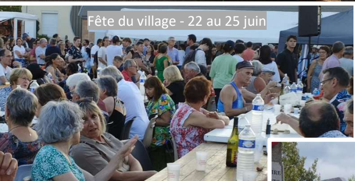
Fête du village - 22 au 25 juin