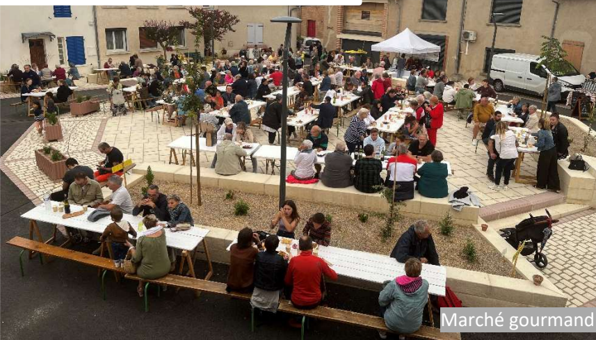
Marché gourmand - 5 août