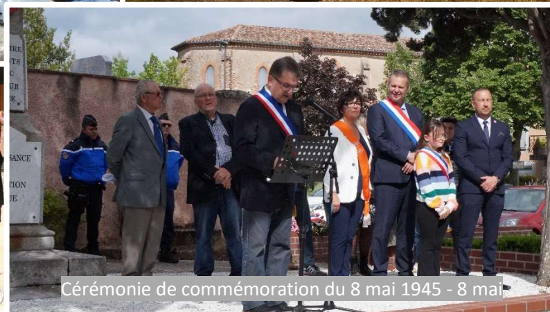
Cérémonie de commémoration du 8 mai 1945 - 8 mai