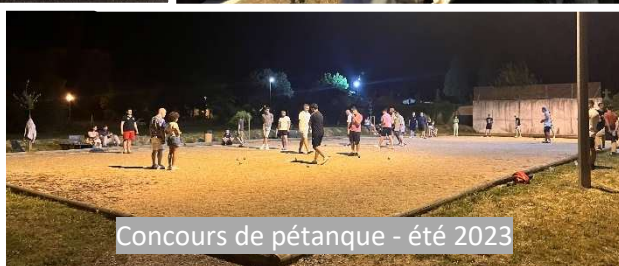
Concours de pétanque - été 2023