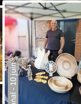
Marché artisanal - 10 juin