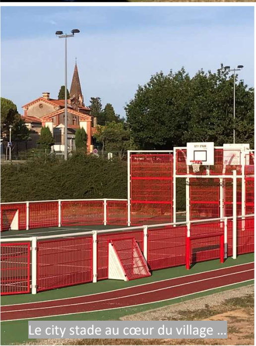
Le city stade au cœur du village ...