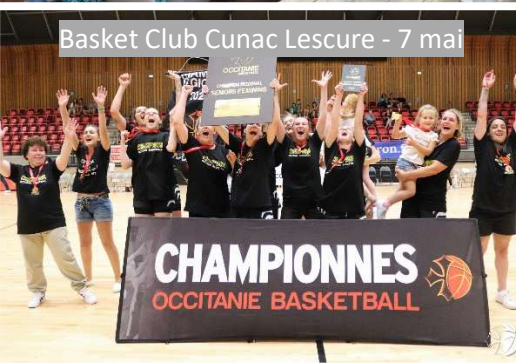
Basket Club Cunac Lescure - 7 mai