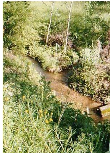
Confluent du ruisseau de Cunac et du ruisseau du Gach (mai 2004).

Lanel : vue sur l'église de Cunac et, à l'arrière-plan, sur le Puech de Barret (349 m) (octobre 2004).