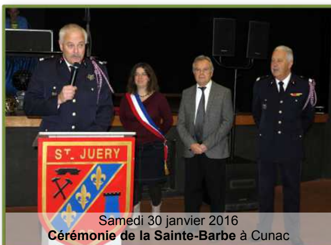
Samedi 30 janvier 2016 Cérémonie de la Sainte-Barbe à Cunac