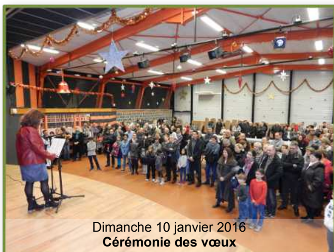
Dimanche 10 janvier 2016 Cérémonie des vœux

Mairie de Cunac - 10 Grand' Rue 81990 Cunac - 05.63.55.13.93 - http://www.cunac.fr