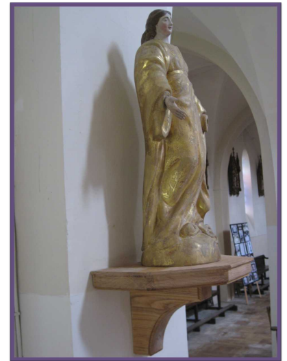
Vierge Louis-Philippe (XI ème siècle)