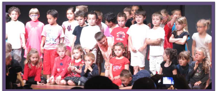
Spectacle de la fête de l'école 16 juin 2016