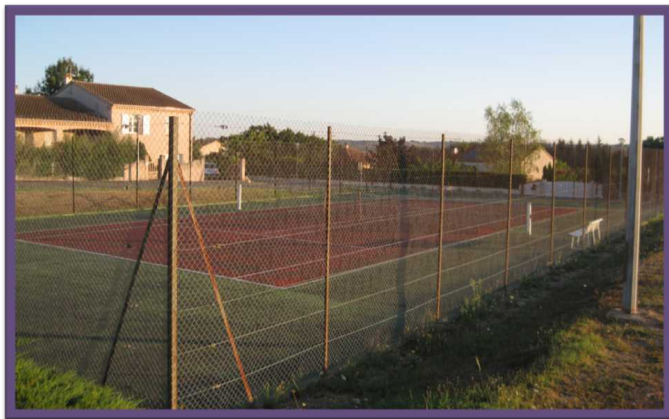
Court de tennis (Rue des écoles)