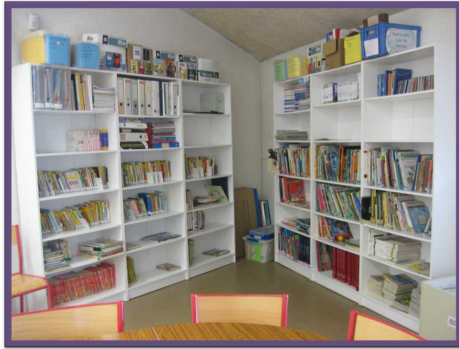
Nouvelle bibliothèque de l'école