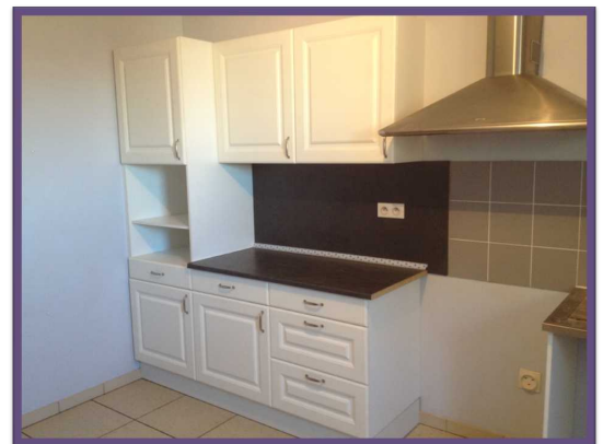
Cuisine intégrée dans un des logements sociaux