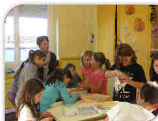
Atelier Tissu et Fil