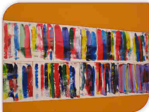
Effets de couleurs à la maternelle

La dépollution du terrain suit son cours. Après avoir été désamianté, l'ancien hangar a été démolie le 4 novembre. Lors de l'excavation de l'une des deux cuves, il a été constaté la présence d'hydrocarbures ainsi que de cendres contenant des métaux lourds. De ce fait, des prélèvements de terre vont être effectués en profondeur afin de déterminer la zone exacte à dépolluer autour des cuves.