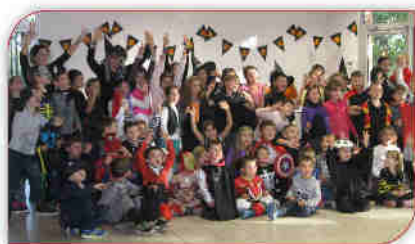
Boom d'Halloween 16 octobre 2015