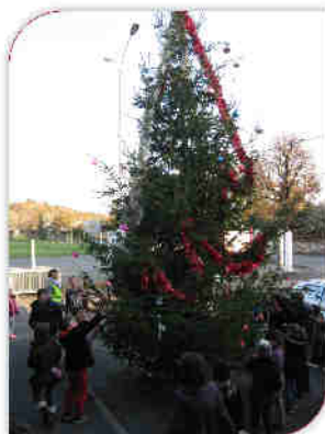
Sapin décoré par l'ALAÉ