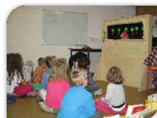
Atelier Contes et Marionnettes