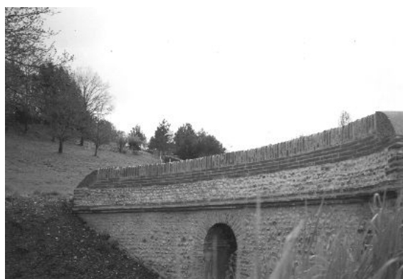
Briques et galets (Pont du Rivatou)