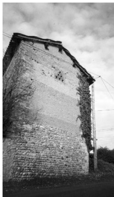
Mur mixte pisé-galets (La Font del Puech)