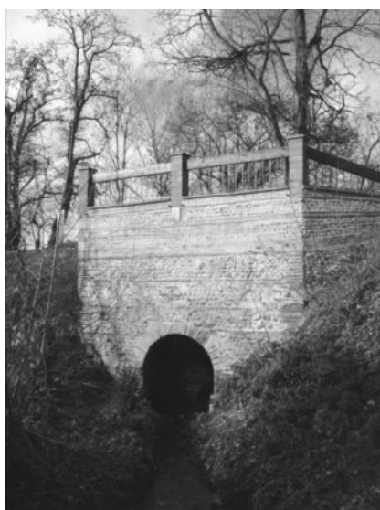
Briques et galets (Pont de la Rasclette)