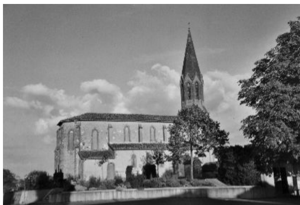
Briques, tuiles romaines et pierre (Église St Jacques)

La fin du labeur donnait lieu à de véritables fêtes. Ainsi, à l'occasion des constructions collectives, les liens familiaux, amicaux et professionnels entre les membres d'une même communauté se trouvaient resserrés par cette solidarité et cette entraide.