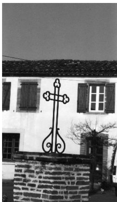
Porte à arc segmentaire, baies en briques et pierres (Patus du Vialar)