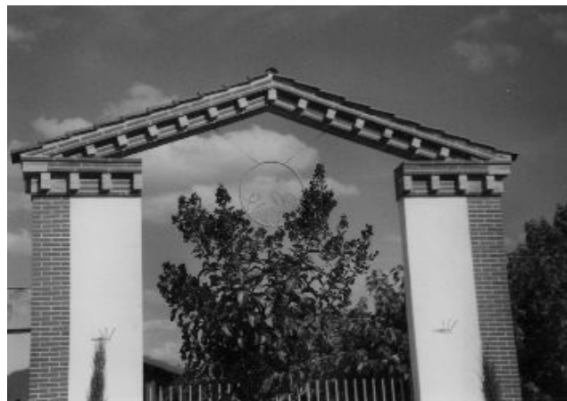
Briques décoratives (École de Cunac)