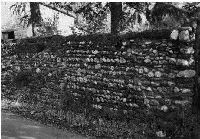
Mur mixte galets-briques (Route des Templiers)

Elles sont fréquentes et allient souvent le pisé * dans les parties hautes et divers matériaux dans les parties basses (briques, galets, tuileaux, pierres), ceci pour des impératifs économiques et techniques. L'emploi de lits de briques est destiné au réglage horizontal permettant de vérifier l'aplomb du mur. Ces murs sont dits mixtes *.