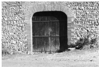
Porte charretière et murs mixtes (Lanel Bas)