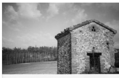
Maison de vignes typique (Chemin de St Eloi)