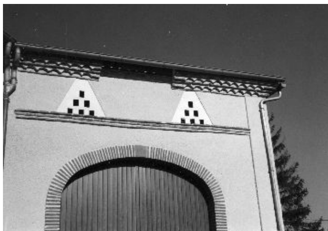
Génoise, pigeonniers intégrés et porte charretière à arc en anse de panier, datée de 1876 (à côté de la Mairie)