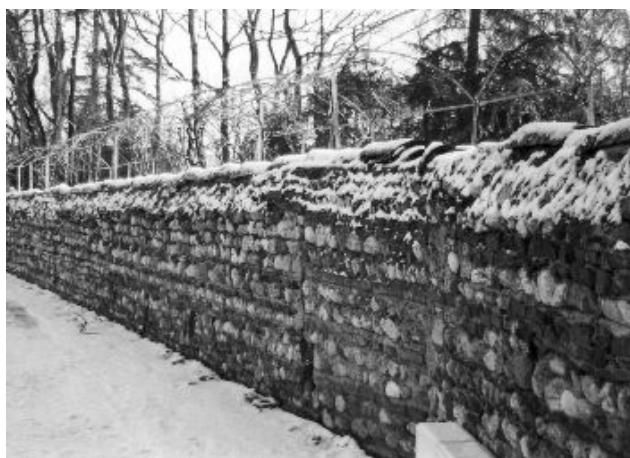
Mur mixte en face de la Mairie (GrandRue)

Les galets servaient à armer le mortier des fondations, élever de simples murets de séparation ou des pans d'habitat. Ils imposaient une importante quantité de liant. On les disposait sur un lit de mortier, en assises pouvant présenter un appareil en opus spicatum* . Pour une meilleure stabilité du mur, on les associait fréquemment à d'autres matériaux (fragments de briques ou tuiles, moellons, lits de briques).