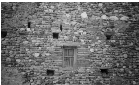
Polychromie et esthétique de vieux murs cunacois