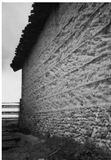
⇐ Mur en galets et pisé, bien marqué par les banchées horizontales (La Pontésié)

« Il est étrange de voir fondre, au fil des ans, ces murs de terre crue...ruine isolée dans un champ, disparaissant lentement au cœur d'un roncier. L'existence d'une ferme semble se clore dans ce retour absolu à la nature, offrant l'illustration d'un cycle écologique parfait. »