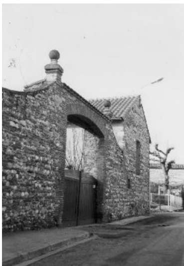
Mur mixte avec porte charretière à arc segmentaire (Grand'Rue)

« Car la brique de ce pays, par l'argile qui la forme, par son épaisseur et sa minceur à la fois, conditionne cette grâce et cette force des maisons anciennes et des monuments. Elle interdit les angles trop vifs, oblige à des dessins plats, larges, puissants mais sans rudesse ou sans inconvenante majesté, solides sans raideur ou lourdeur. Il faut distinguer dans cette architecture de la brique, le mouvement de l'ensemble et comme la broderie intérieure, chaque morceau de cette argile cuite étant la cellule nécessaire et modeste de la totalité, gardant une couleur particulière dans la tonalité d'ensemble, une forme précise dans l'espace occupé. D'où ces impressions d'envol et de poids qui se conjuguent, cette solidité et cette fragilité qui s'harmonisent. Rien de gracile, rien d'évanescent dans ces briques jointes. Le sens de la terre, la proximité de la glèbe, et en même temps l'essor prudent mais vif d'un élan vers le ciel. »