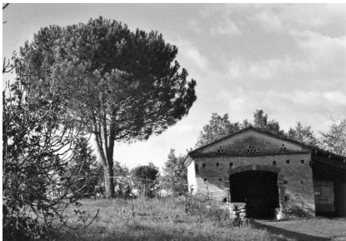
Ancienne grange (Chemin du Gach)

La charpente était montée au pied du bâtiment puis hissée sur la maison par les maçons, charpentiers, menuisiers ou couvreurs. Quand ils montaient les tuiles, c'était la fête.