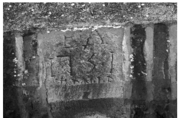
Clé de voûte (La Pontésié)