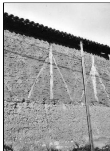
Mur mixte de pisé et à colombages rempli de briques (ancienne ferme de Lanel Bas) ⇨