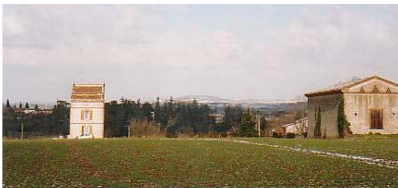
Lanel : pigeonnier restauré et grange. A l'arrière-plan, le Puy Saint-Georges (507 m) enneigé (février 2005).

Au point de vue géologique, le Puy Saint-Georges est un monadnock , relief résiduel dominant une pénéplaine et dont la conservation manifeste l'exceptionnelle résistance du matériel rocheux (quartzite).