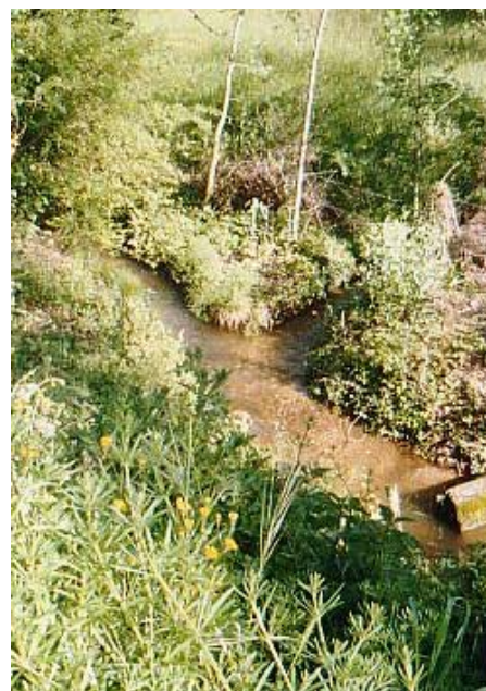
Confluent du ruisseau de Cunac et du ruisseau du Gach (mai 2004).

Lanel : vue sur l'église de Cunac et, à l'arrière-plan, sur le Puech de Barret (349 m) (octobre 2004).